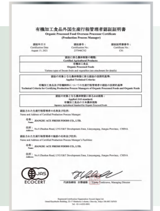
Японский сертификат на органическую продукцию