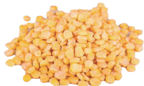
香糯玉米粒 Ароматные клейкие зерна кукурузы