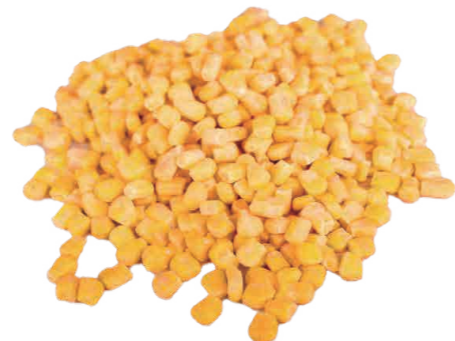
水果玉米粒 Зерна фруктовой кукурузы