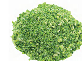
西兰花碎 Измолотый брокколи