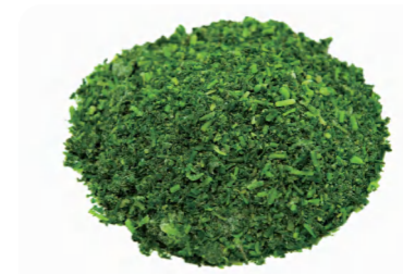
芥菜碎 Измолотая пастушья сумка