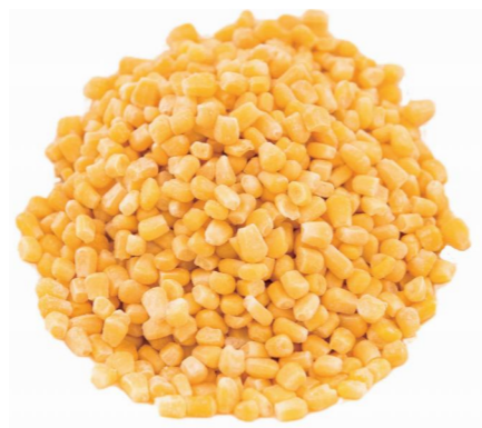
高叶酸玉米粒 Зерна кукурузы с повышенным содержанием фолиевой кислоты