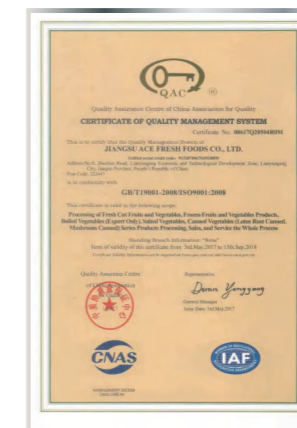
Сертификат системы менеджмента качества