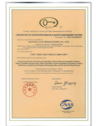
Сертификат системы менеджмента охраны труда и безопасности