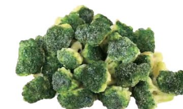
高原西兰花 Брокколи из высокогорья