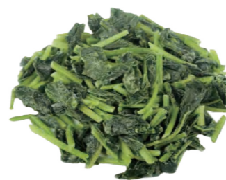
菠菜段 Нарезанный шпинат