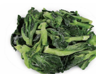
菜心 Китайская капуста цайсин