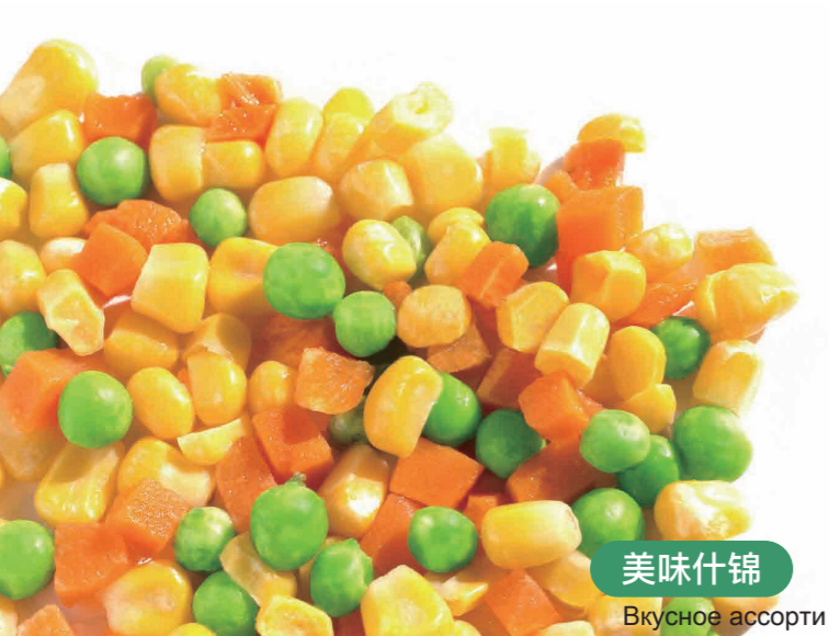
美味什锦 Вкусное ассорти