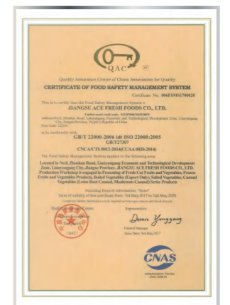
Сертификат системы менеджмента безопасности пищевой продукции