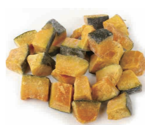
板栗南瓜 Тыква каштановая