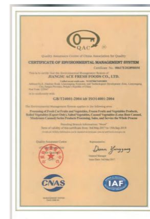
Сертификат системы экологического менеджмента