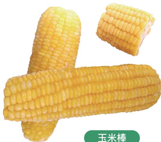
玉米棒 Кукурузные початки