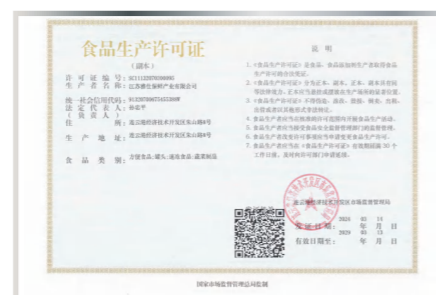
Лицензия на производство пищевых продуктов