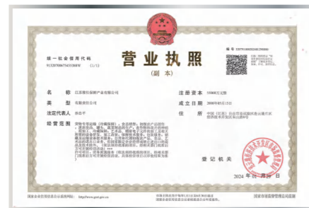
Цзянсуская компания «Яши» по консервации продукции