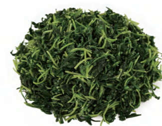
马兰头碎 Китайская капуста цайсин