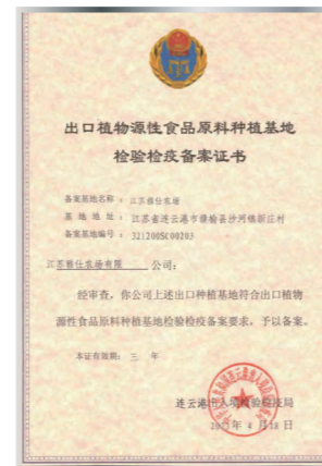
Свидетельство о регистрации в системе инспекции и карантина