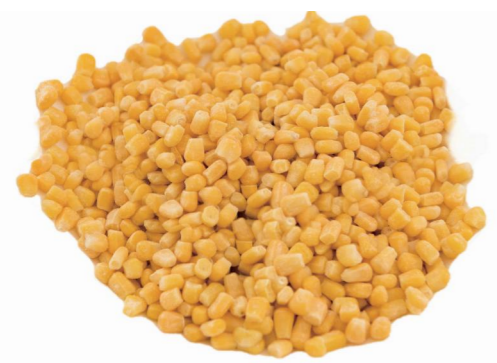
牛奶玉米粒 Зерна молочной кукурузы