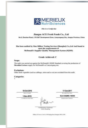
Сертификат системы менеджмента качества поставщиков McDonald's