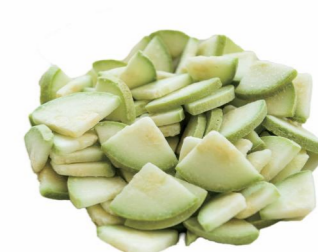
笋瓜片 Ломтики кабачка