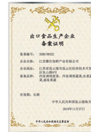
Быстрозамороженные фрукты и овощи, отваренные овощи