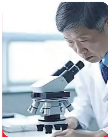
“变温溶剂萃取-冷冻结晶技术”