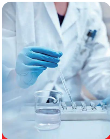
“高纯度叶黄素的提取分离技术”