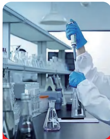
“用色谱法制备高纯度番茄红素的方法”发明专利