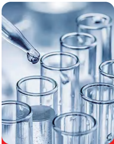
“葡萄色素提取分离技术”形成专有技术证